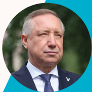
Губернатор Санкт-Петербурга Александр Беглов

— Мы продолжаем повышать уровень поддержки петербургских семей с детьми. Однако, чтобы повысить рождаемость, необходим комплексный подход, включающий улучшение жилищных условий, доступность качественной медицины, возможность обучения и работы для женщин, развитие семейно-ориентированной инфраструктуры. Нам недостаточно только финансово поддерживать семьи. Нужно создавать условия, чтобы люди чувствовали себя уверенно, могли совмещать карьеру и семью.